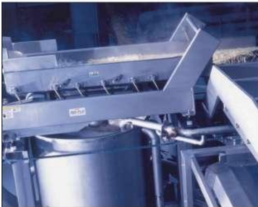
Конвейер с функцией обезвоживания Key

Key's Smart Shaker® Конвейер предлагает решения по обезвоживанию продукции для многих отраслей производства и обеспечивает производителей легкостью установки и долговременной работой. Оборудование данного типа установлено по всему миру, в различных размерах и производственных мощностях.